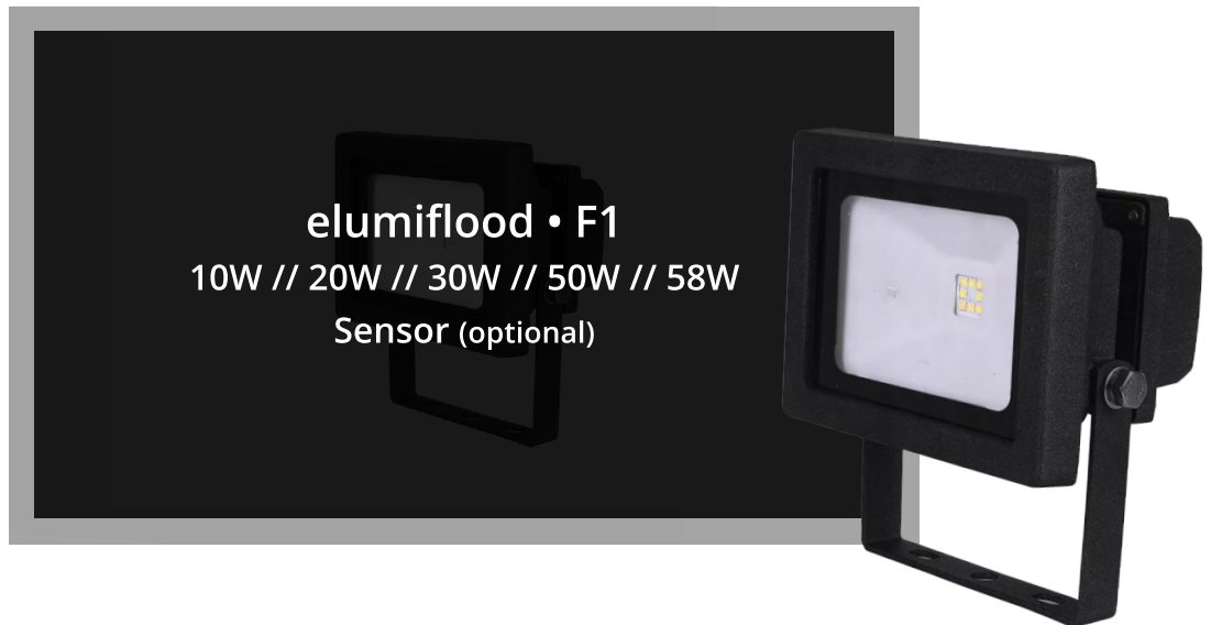
elumiflood • F1 10W // 20W // 30W // 50W // 58W Sensor (optional)

Traditionelles LED Flutlicht mit einem breiten Abstrahlwinkel von 120°. Flexible Installation und Nutzung: Mit der Metallhalterung kann die Lampe an der Decke, an der Wand oder am Boden montiert werden. Der Lampenkörper ist um 180° verstellbar. Aluminiumdruckguss und Hartglas verhindern die Überhitzung. Mit der Schutzart IP65 kann das einstellbare Flutlicht problemlos im Außenbereich verwendet werden. Optional mit Bewegungssensor.